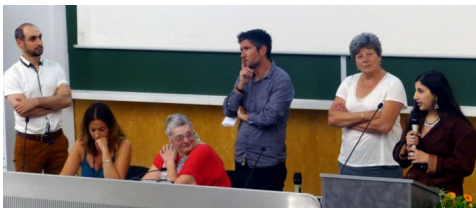
La lauréate du 1 er Prix aux côtés du jury

Retrouvez sur notre site le compte-rendu complet, avec les mémoires et leurs synthèses !