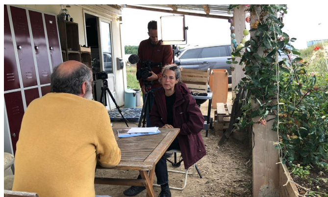
Jour de tournage documentaire à la Ferme de l'Envol (Coeur Essonne Agglomération)

La méthode croise entretiens et observations sur quatre terrains diversifiés dans leur forme, leurs outils, leurs fonctions et leur contexte. L'originalité est de s'emparer de la vidéo pour mener l'investigation : la recherche sera ainsi présentée sous forme de film documentaire et discutée à la fin de cette année.